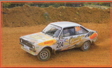
Terre de Vaucluse VHC-Rétrocourse