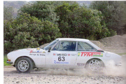
◆ La Peugeot 504 coupé V6 d'Eric Tymrakiewicz/Patrick Gaillard apporte de la variété à un plateau très fortement marqué par les Porsche et les Ford Escort.