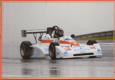
Historic Tour à Ledenon