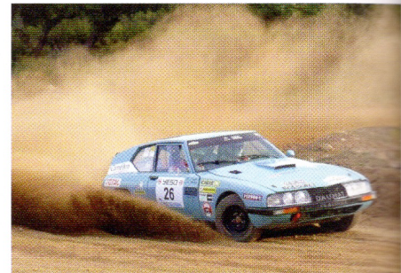
◆ Reparti en Super Rallye, Frédéric Daunat (Citroën SM) s'est fait plaisir sur les pistes sardes.